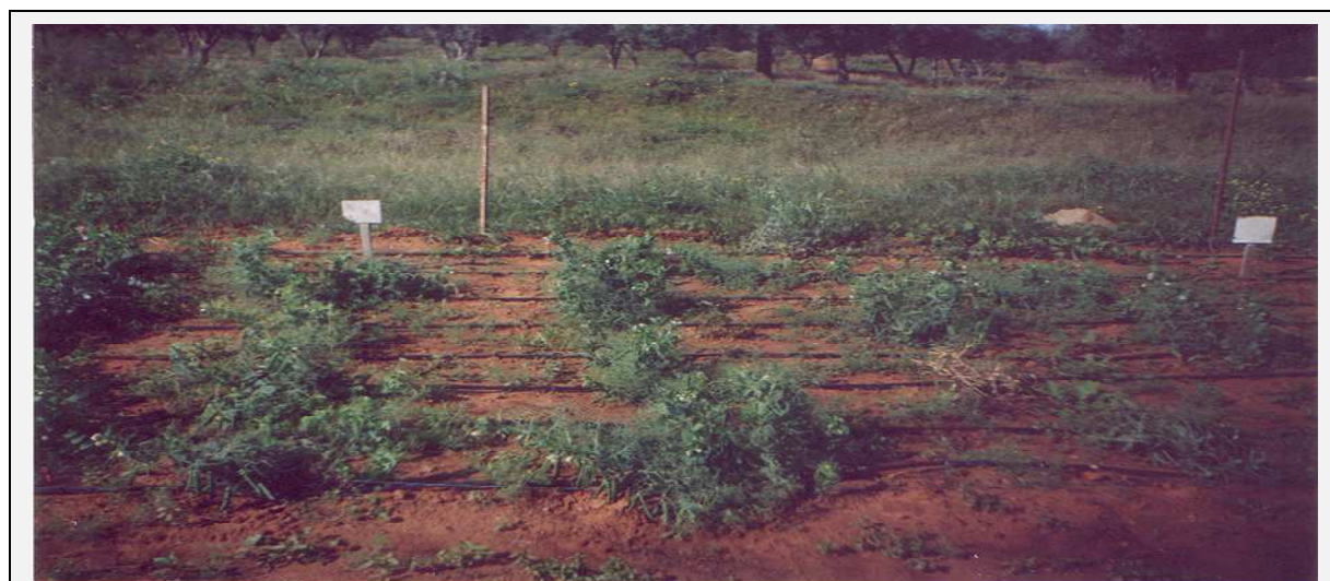
Figure 3: Distribution des génotypes par parcelle élémentaire en plein champ